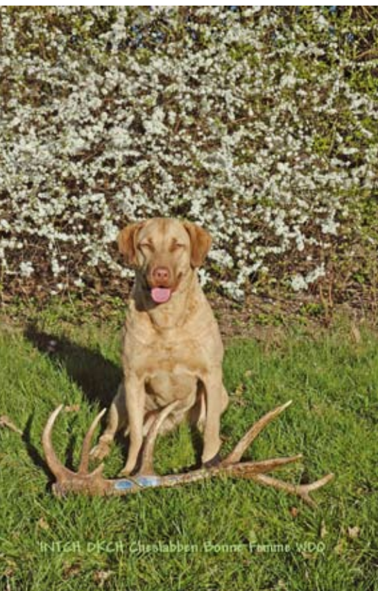
Den seneste chesapeake champion DKCH og INTCH f. 2004, som tillige er en dygtig markprøve- og schweisshund.