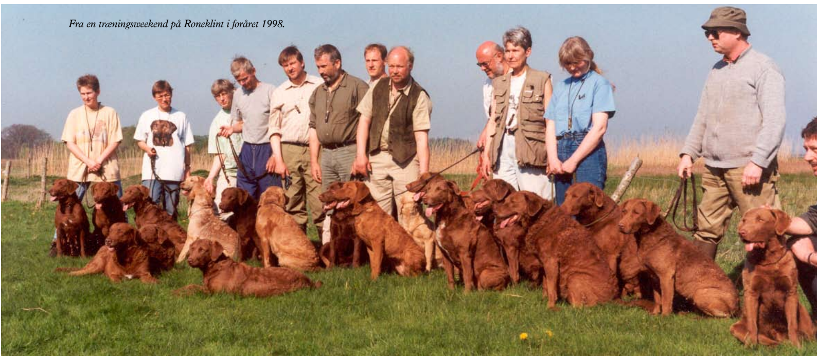
Fra en træningsweekend på Roneklint i foråret 1998.

Eksteriørdommerne kan gøre meget for at hjæl-