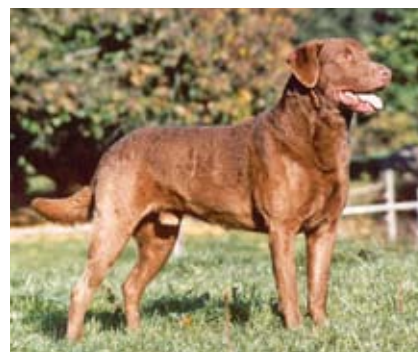
Import fra Wales f. 1992 med mange championater og gruppeplaceringer, 3 x verdensvinder, årets hund i DRK 2001

I efteråret 1967 importeredes flere chesapeakees til Danmark fra USA og Holland. I de første to årtier herefter opdrættedes i snit 2-3 kuld om året. Ikke mange kendte til racen, men det sparsomme udbud af hvalpe var ikke nødvendigvis et minus; de særligt interesserede fik den hvalp, de ville have. Ofte var (og er) hvalpekøberne passionerede ande- og gåsejægere, der havde læst eller hørt om denne amerikanske retrieverrace, hvis historie begyndte i 1807 med et skibsforslis i Chesapeakebugten ud for Marylands kyst. Med fra USA fulgte en del fordomme og et dårligt ry for at være en "svær" hund; stædig, aggressiv, meget vagtsom, hård og grim var blot nogle af mærkaterne, der blev sat på racen, ofte hørte man denne karakteristik fra folk, som aldrig havde kendt en chesapeake endsige ejet en selv - og i hundelitteraturen virkede det jævnlige, som om forfatterne til diverse bøger og artikler om retrievere skrev af efter hverandre, når de kom til afsnittet om chesapeake. Det var de samme 5-6 negative egenskaber, der blev beskrevet - og så var