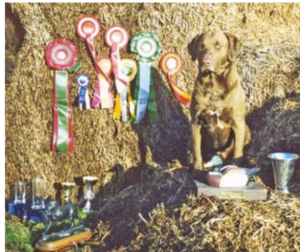
USA-import med stor indflydelse i avlen, f. 1997. INTCH DKCH(+?) LP2 m.m. Årets avlshund i DRK 2002

smukke, upraktiske faner; en blød pels, behagelig at røre ved, men ikke det mindste vand- og smudsafvisende; eller rare, mørkebrune øjne, som ikke er forbudt men heller ikke noget krav for arbejdets udførelse.