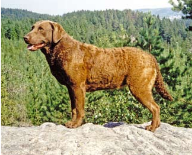
Dansk opdrættet tæve f. 1993 med meget afkom i avl, INTCHVV DKCH(+?) samt 1. pr. schweiss og LP. Årets hund i DRK 1997

En væsentlig årsag til chesapeakens status som dual purpose-hund (en hund, der både ser ud som den skal ifølge racestandarden, og kan udføre det arbejde, den er fremavlet til som jagthund) er racens eksteriørstandard. Alt hvad der står i standarden for chesapeake, er skrevet for at gøre racen til en effektiv og udholdende apporterende jagthund med speciale i vandarbejde. Her er ingen ekstra krav om "skønhed" og elegance; fx lange,