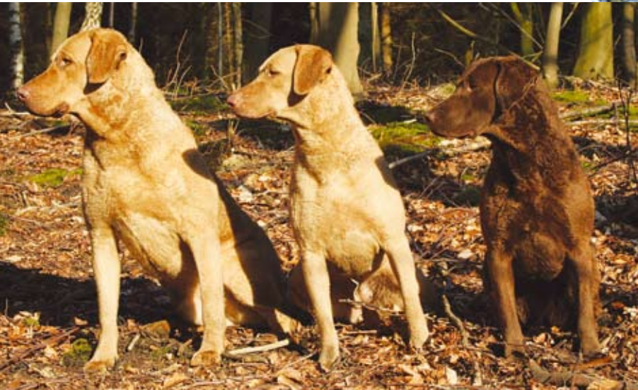
Chesapeake Bay Retriever i sit rette element - vandarbejde

fra højre bedste hund i WD/X/Q Penrose Cool Dawn, Cheslabben Flower by Kenzo, Cheslabben Dirt Harry